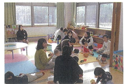
子育て交流会 (主催: おおだっこ)

地区社協や自治会、サロン団体などを始めとした地域における様々な活動への取組みを支援します。