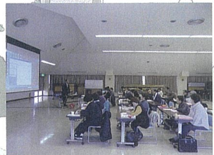
市民後見人養成講習会