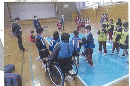
小学校での福祉学習 (ユニバーサルポッチャ交流会)

地域住民が交流しつながりを深めることにより地域への参加と関心を高めるきっかけづくりを進めます。