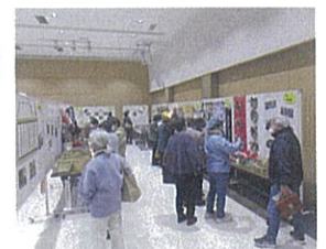
地域における居場所づくりの推進 (サロンフェスティバル)