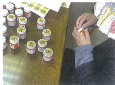
はたらきっかけ応援事業「こねくとステップ」