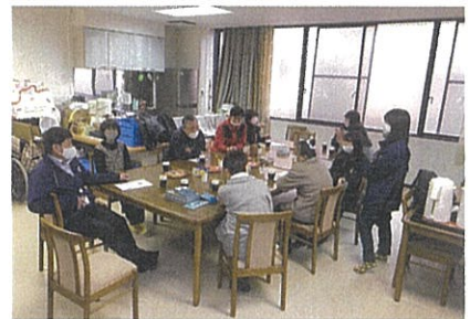
社会とのつながりづくり応援事業「こねくと」

分野を超えた包括的な相談支援体制を構築するとともに、地域資源を活かしながら、社会とのつながりづくりに向けた支援を行います。