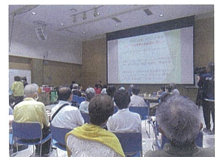
防災カフェ (島根県西部地震復興フォーラム)