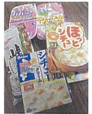
食糧支援イメージ