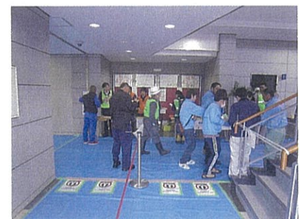
災害ボランティアセンター (H30年島根県西部地震)