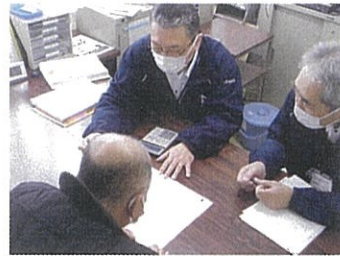
利用者との面談の様子

生活困窮者自立相談支援窓口（生活サポートセンターおおだ）の啓発と相談体制の強化を図ります。