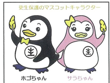
更生保護のマスコットキャラクター