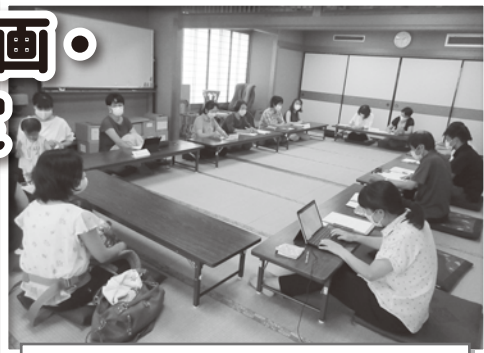
子育てサロンへのヒアリングの様子

そのため、アンケート調査、市内の各種団体へのヒアリングや地区社会福祉協議会とのワークショップなどを行いました。今後はこれらをまとめ、計画策定委員会においてご意見をいただきながら計画を作成します。