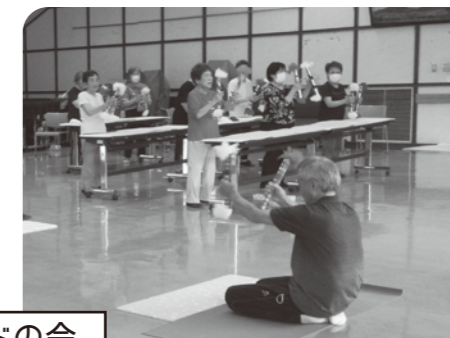
大田 ゴールドの会