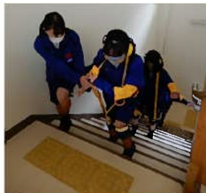
疑似体験用具を装着した歩行体験の様子

年齢を重ねることによる体の変化や認知症などの理解についての講話や道具を使用した高齢者疑似体験を行います。