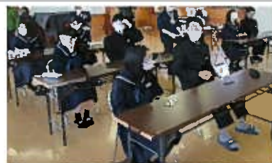
視野狭窄グラスを使用した視覚障がい疑似体験の様子