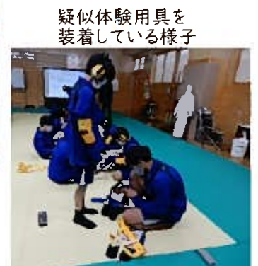
疑似体験用具を装着している様子