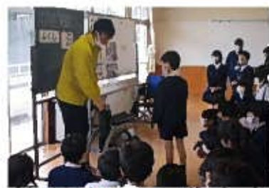
車いすの使い方説明の様子